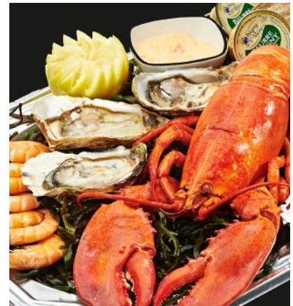
PLATTE FISCH UND MEERESFRÜCHTE